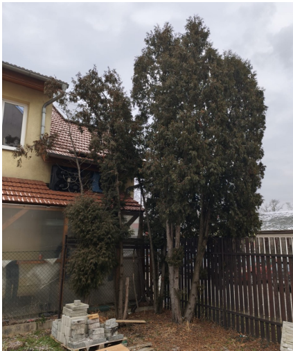
Dřeviny D1 až D4