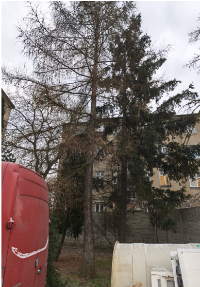
D6 a D7

Na pozemku č. 1055, který je rovněž v majetku investora a který není dotčený stavbou, ale přímo s ní sousedí, se vyskytuje 7 kusů dřevin. V koordinační situaci jsou označeny jako dřeviny D6 až D12.