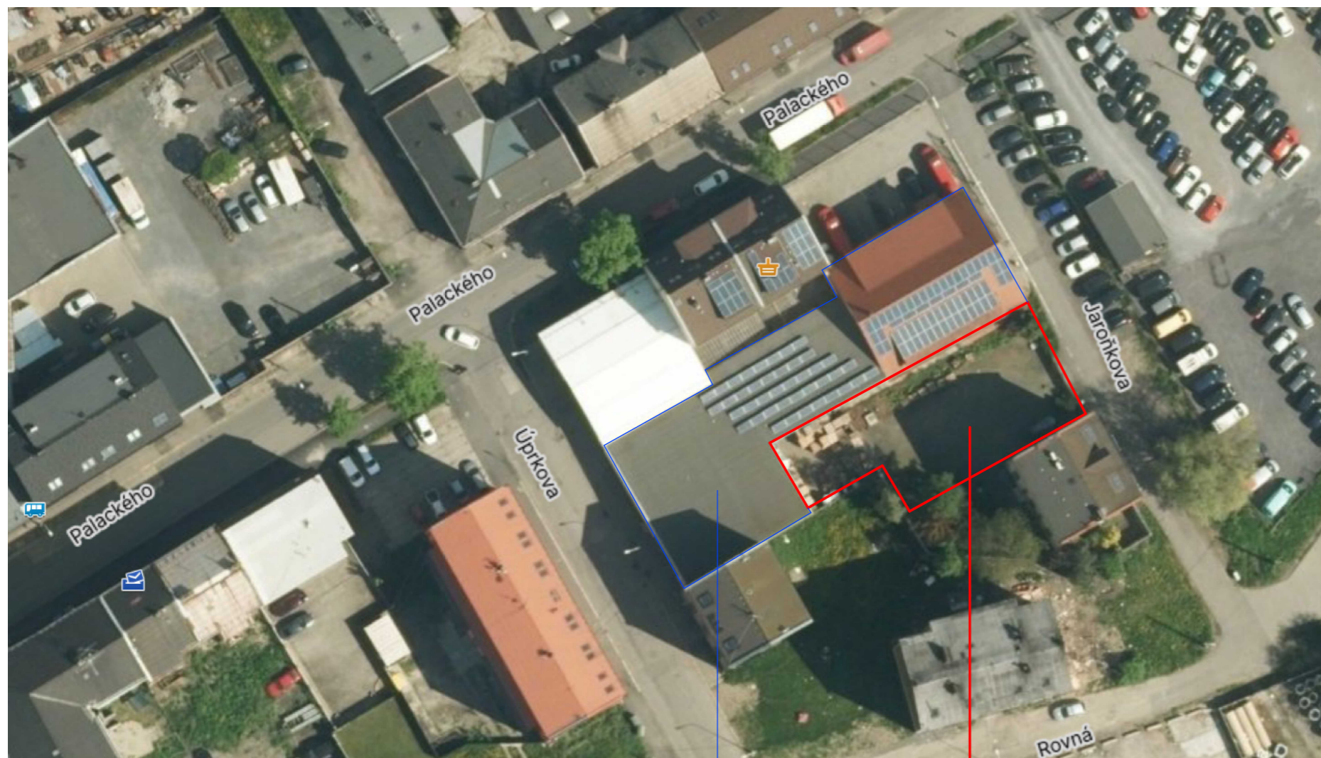
Skladová a výrobní hala – Stávající objekt

MÍSTO STAVBY SO 01 Skladová a výrobní hala – Přístavba