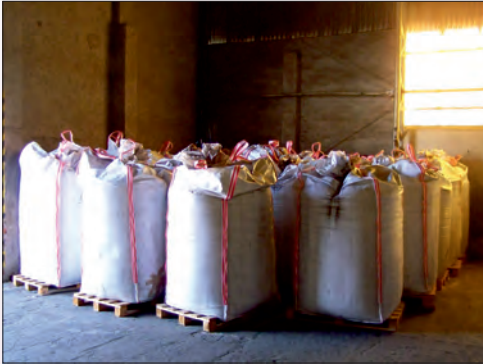
Sušená plná krev