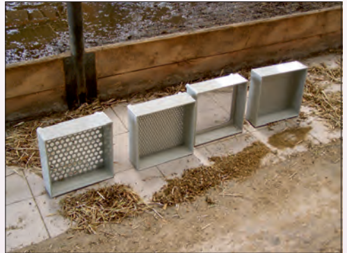
Síta pro stanovení jednotlivých frakcí krmiv