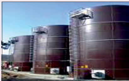
Skladování kapalných hnojiv