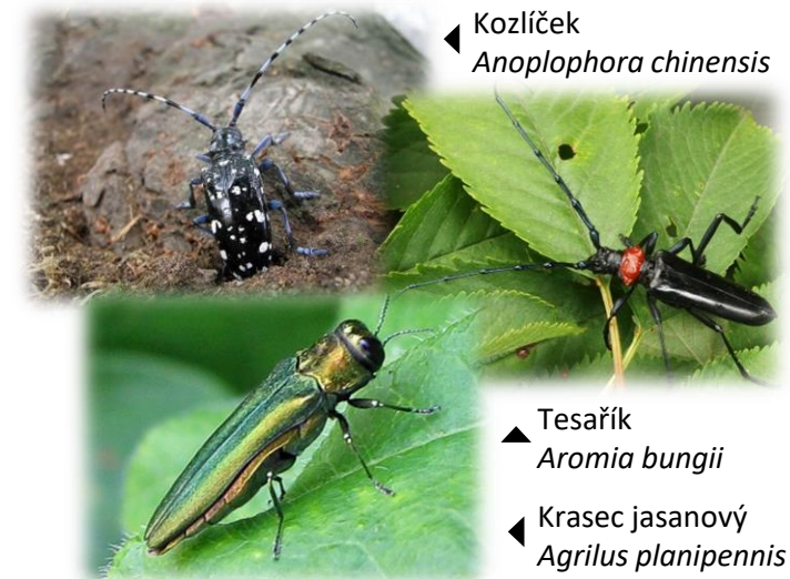
◀ Kozlíček Anoplophora chinensis

S výpěstky okrasných dřevin se může šířit řada dalších karanténních a nepůvodních druhů tesaříků, krasců či původců chorob.