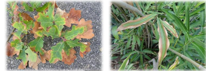
Rostliny napadené bakterií Xylella fastidiosa ▲ ▲

Z u nás pěstovaných plodin napadá bakterie např. peckoviny a révu vinnou. Velmi náchylným hostitelem k napadení bakterií je vítod myrtolistý. Právě vítod myrtolistý, ale i oleandr obecný nebo okrasné kávovníky, případně léčivé a aromatické rostliny, jako je levandule nebo rozmarýn, pocházející ze zemí, kde se bakterie vyskytuje, mohou být při internetovém obchodu významným rizikem pro její šíření.