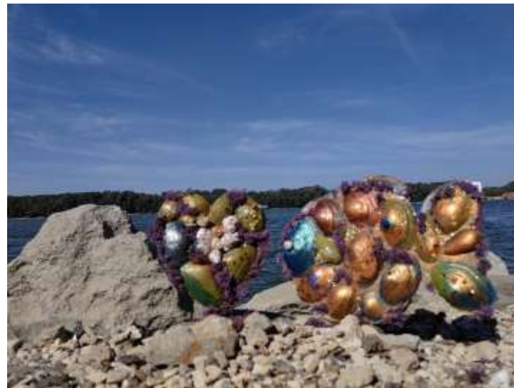
Vítězné dílo Dunajského umělce 2023, kategorie 6-11 let, Sdružení "Danube Shine", Ruse, Bulharsko