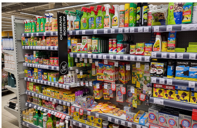
Prodej povolených hobby přípravků

Vấn đề chế phẩm không hợp pháp không chỉ liên quan đến nông dân hay người sử dụng chuyên nghiệp. Ngay cả chế phẩm mua để dùng trong vườn tại nhà cũng phải được cấp phép tại Séc. Các chế phẩm dành riêng cho người dùng chuyên nghiệp chỉ được phép giao cho người có chứng chỉ năng lực chuyên môn, chứng minh đủ điều kiện để xử lý chế phẩm. Các chế phẩm này chỉ được cung cấp bởi nhà phân phối đã đăng ký.