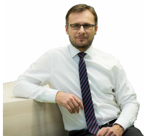
Zdeněk Nekula ministr zemědělství

Plán jsme připravili podle aktuálních i dlouhodobých potřeb zemědělství, potravinářství a lesnictví, přičemž, jak už jsem uvedl, jsme se hodně zaměřili na ekologii. O jeho podobě jsme od začátku jednali se zainteresovanými institucemi a zástupci zemědělství, potravinářství a lesnictví. Nejvíce peněz půjde do podpory ekonomicky životaschopného zemědělství, a to jako základní záchranná síť pro udržení konkurenceschopnosti našich zemědělců a zajištění dostatku potravin. Pomáhá vybalancovat současnou nestálost zemědělských trhů a příjmů zemědělců. Hlavní změnou ve Strategickém plánu je zavedení podpory na první hektary ve výši 23 procent. Platba je určena na prvních 150 hektarů všech zemědělských podniků bez ohledu na jejich velikost, což výrazně podpoří menší a střední zemědělce, zároveň ale zajistí dostatečnou podporu i pro větší podniky. Prioritou Plánu je ekologické zemědělství. Do roku 2030 chceme jako ekologickou spravovat čtvrtinu veškeré zemědělské půdy. Samozřejmě s ohledem na aktuální situaci a potřebu zajistit dostatek kvalitních potravin. Důraz klademe i na precizní zemědělství, takže pokud zemědělci použijí jeho postupy, nově mohou získat dotaci. Podpora rozšiřování těchto postupů do praxe bude jedním z klíčových faktorů rozvoje zemědělství, které - a opět jsme u toho zásadního - bude šetrnější k životnímu prostředí, lépe ochrání přírodní zdroje, biodiverzitu a přispěje ke kvalitě a bezpečnosti potravin.