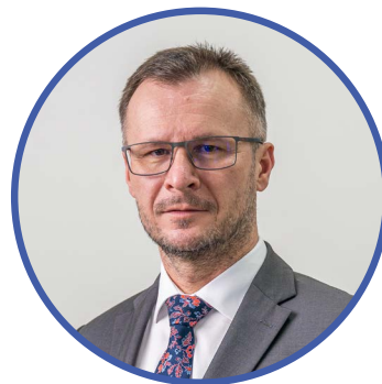
Zdeněk Nekula ministr zemědělství

Ruská agrese na Ukrajině vedla ke snížení nabídky hnojiv, což způsobilo růst cen. To má dopad na všechny evropské zemědělce a mohlo by ohrozit budoucí úrodu, a to nejen v Evropě. Proto jsme se shodli, že je nutné přijmout další opatření, aby hnojiva i konečné zemědělské a potravinářské produkty zůstaly cenově dostupné.