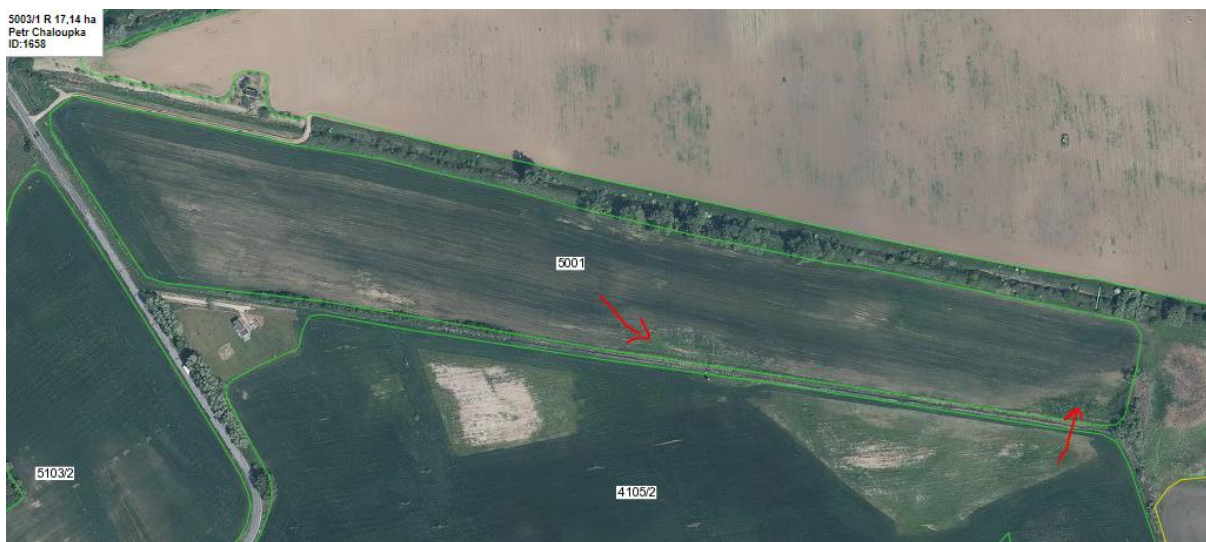
Obr.: Potenciální mokřady (LPIS)

Konkrétní území je pracovníkem OOP posouzeno nad ortofotomapou, následně je provedeno ověření stavu v terénu a zaměření hranic mokřadu GPS.