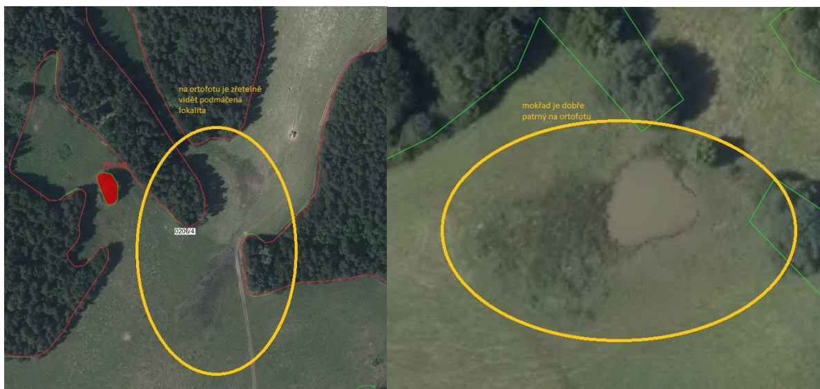
Obr.: Příklad mokřadů jak jsou vidět na ortofotech (LPIS)

Jako podklad pro vymezení mokřadů lze využít vrstvu mapování mokřadů v ČR zpracovanou Agenturou ochrany přírody a krajiny (AOPK).