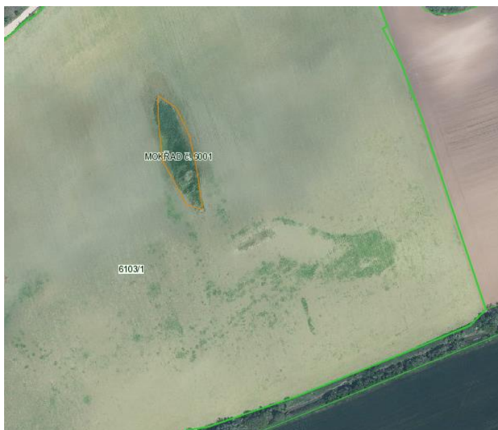
Obr.: Potenciální mokřady (LPIS)

V případě, že se EVP mokřad nachází na DPB s kulturou R, U, G je možné jej využít i jako plochu EFA.