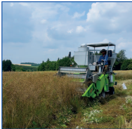
Foto: Operační skupina Fertilization using locally applied biogas slurry and pelleted green legumes – A new approach to fertilization and weed control in organic rapeseed production, Německo (Sasko)

ků bude operační skupina hodnotit účinky těchto speciálních pelet na produkci řepky olejné. Cílem aktivity je prověřit a zavést do praxe nový způsob využití dusíkatého hnojení při produkci řepky na ekologických farmách, při kterém se zlepšší „životní podmínky“ pro pěstovanou plodinu, sníží zaplevelení polí a zvýší výnosy zrna.