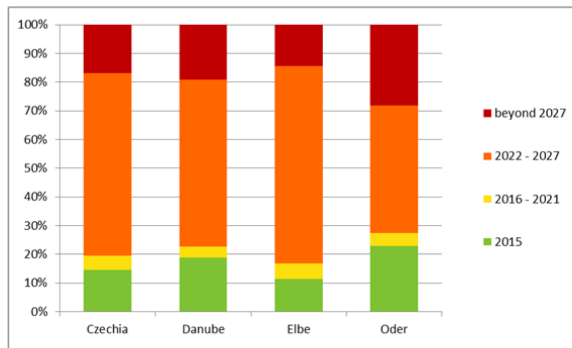
Chart 2.2.3 Expected achievement date of good ecological status or potential of surface water bodies 3