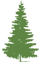
smrk pichlavý 10 až 13 let