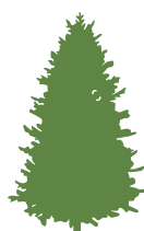
borovice lesní 7 až 8 let