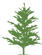
jedle kavkazská 10 až 15 let