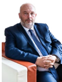
Miroslav Toman ministr zemědělství

Kolegyně a kolegové, chci vám poděkovat za vaši práci, která je v současné situaci nesmírně důležitá, díky vám máme v obchodech dostatek potravin pro obyvatele a patří vám za to uznání. Přeji vám všem pevné zdraví.